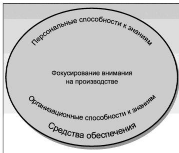
Рисунок 1 - Основа менеджмента знаний

1 Фокусирование внимания на производственной деятельности должно быть центром любой инициативы в области МЗ и представлять собой дополнительную значимость для организации, и может, как правило, включать разработку стратегии, инновацию продукта (услуги) и разработку, производство и доставку услуги, поддержку реализации продукции и потребителей. Эти процессы представляют собой внутренний организационный контекст, в котором создается и применяется знание о продуктах и услугах, потребителях или технологии.