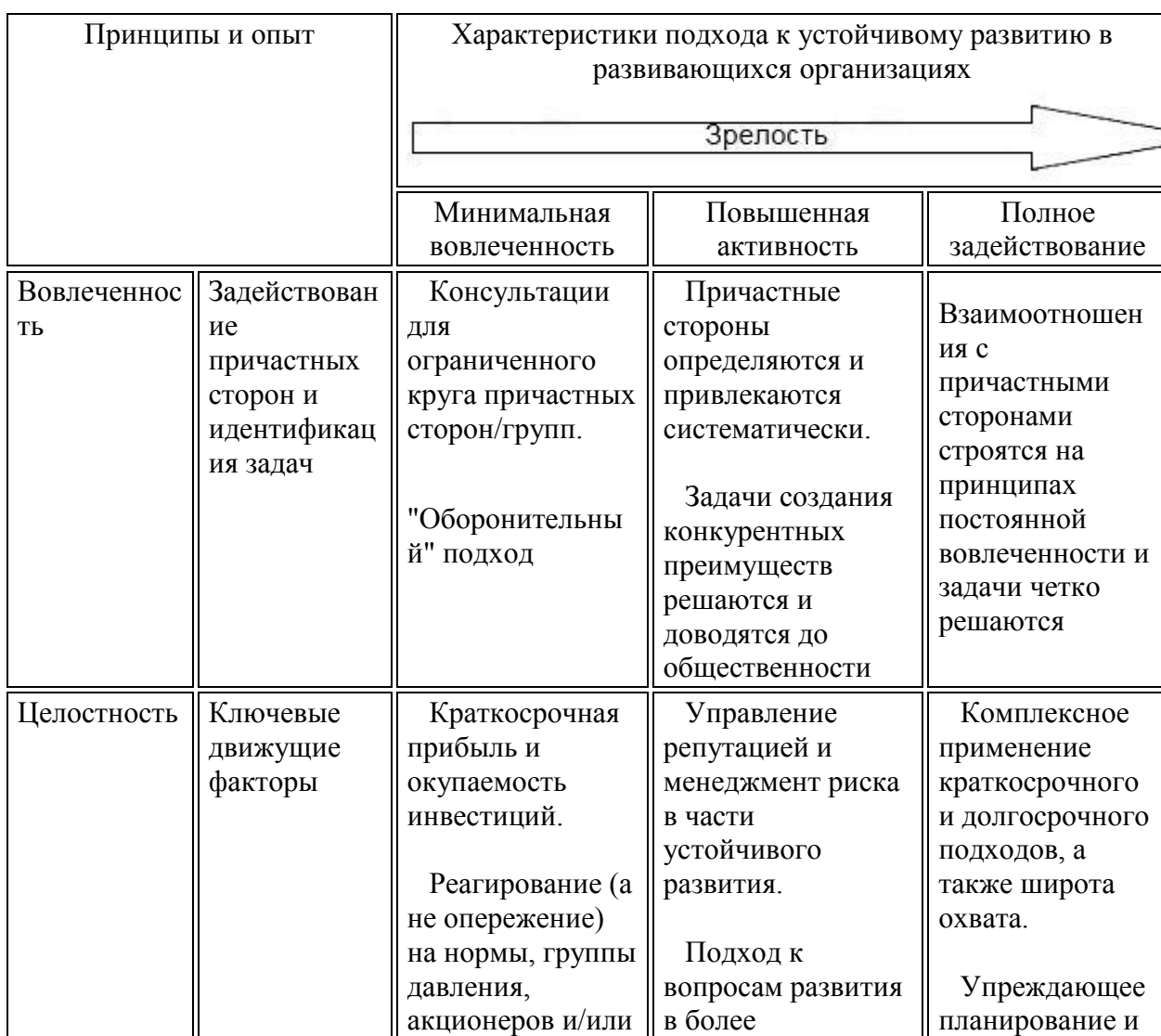
Таблица А.2 - Примерная структура матрицы зрелости устойчивого развития - руководящие указания по постоянному улучшению

Организации должны подготовить свою собственную матрицу зрелости или подобный инструмент управления на основании примера, представленного в таблице А.2, а также с учетом связанных с ними принципов (см. руководство в таблице А.1) и опыта. Для краткости изложения термин "матрица зрелости" означает подход.