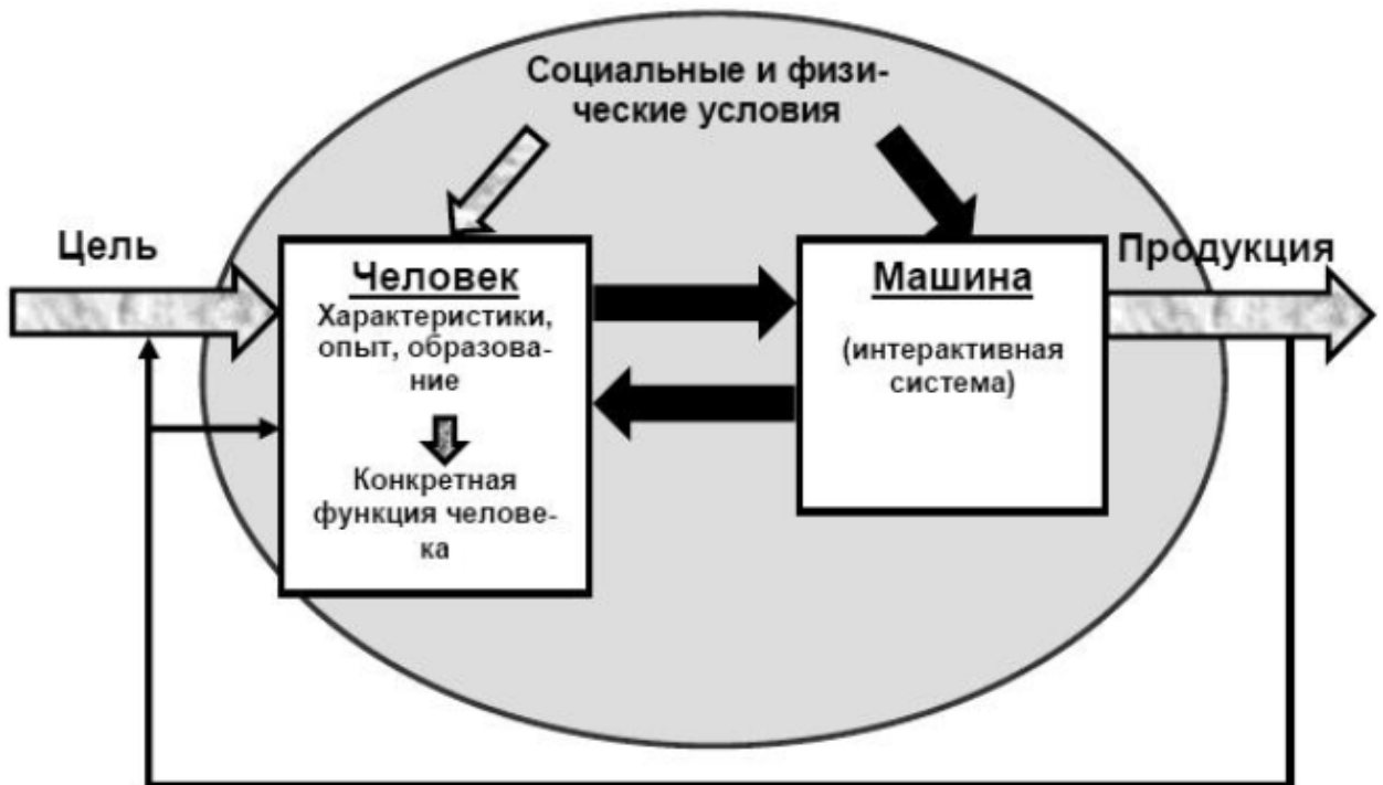
Рисунок 1 - Компоненты системы и их взаимодействие

Серые стрелки представляют факторы, определяющие производительность (PSF) (см. 4.4).