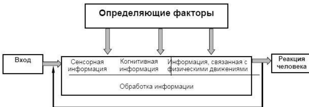
Рисунок 3 - Простая модель обработки информации человеком

Вход на рисунке 3 охватывает цели задачи, условия рабочей среды и обратную связь.