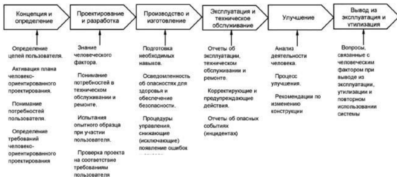
Рисунок 5 - Аспекты, связанные с действиями человека в соответствии со стадиями жизненного цикла системы