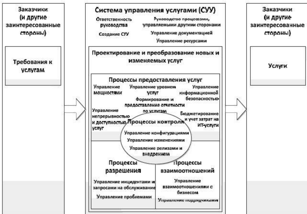
Рисунок 2 - Система управления услугами