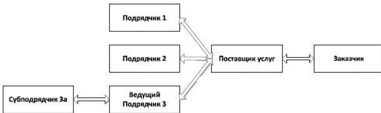
Рисунок 3 - Пример взаимоотношений в цепочке поставок

Для каждого подрядчика поставщик услуг должен иметь назначенного сотрудника, который отвечает за управление взаимоотношениями, договорами и производительностью подрядчика. Поставщик услуг и подрядчик должны заключить договор. Договор должен включать или содержать ссылку на: