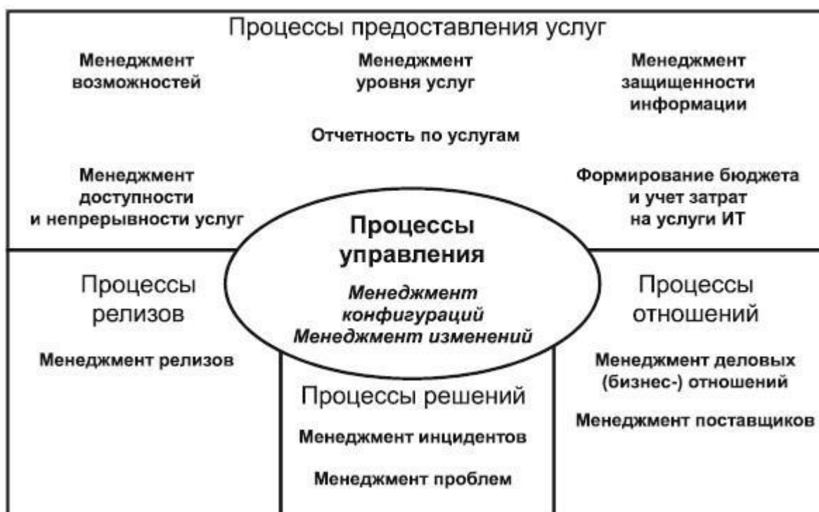
Рисунок 1 - Процессы менеджмента услуг