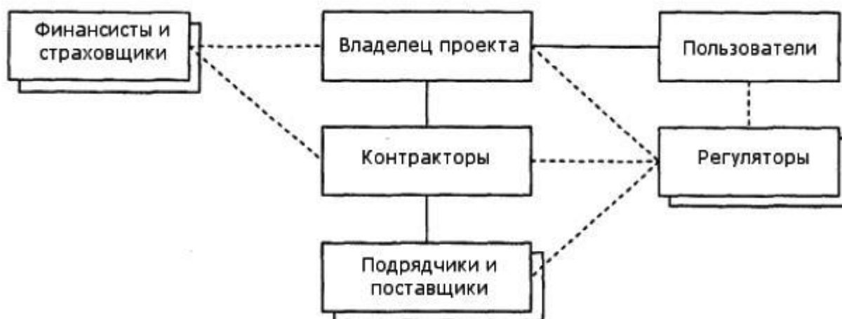
Рисунок 1 - Заинтересованные стороны проекта