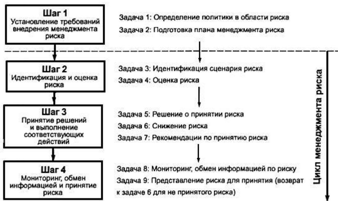
Рисунок 2 - Задачи, соответствующие шагам процесса менеджмента риска в пределах цикла менеджмента риска

Шаг 1 включает установление политики предприятия в области риска (задача 1) и плана менеджмента риска (задача 2). Выполнение этих двух задач является началом проекта. Процесс менеджмента риска состоит из множества циклов менеджмента риска, выполняемых на протяжении проекта, и включает шаги 2-4, подразделенные на семь задач (задачи 3-9).