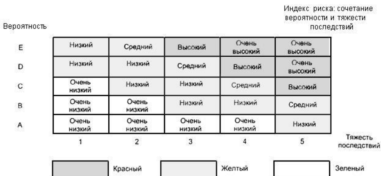
Рисунок 5 - Пример структуры и индекса риска

g) установление критериев для определения действий, которые должны быть предприняты на основе полученных рисков, и связанных с ними решений (см. рисунок 6)*;