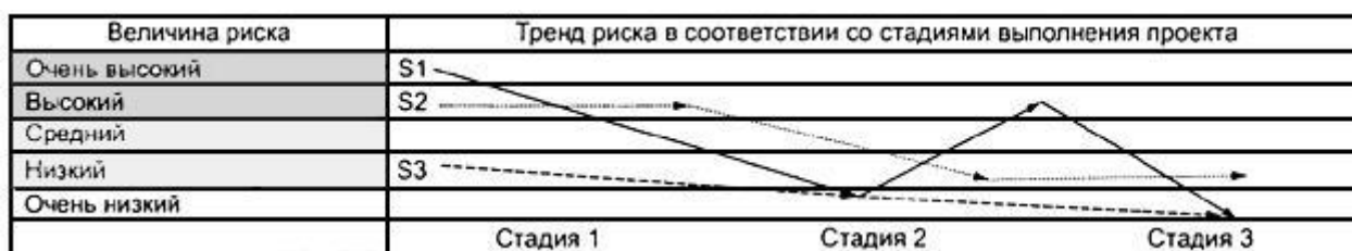
Рисунок 7 - Пример изображения тренда риска