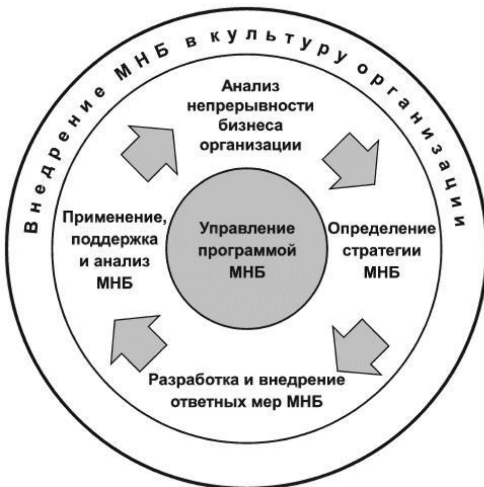
Рисунок 1 - Этапы жизненного цикла менеджмента непрерывности бизнеса