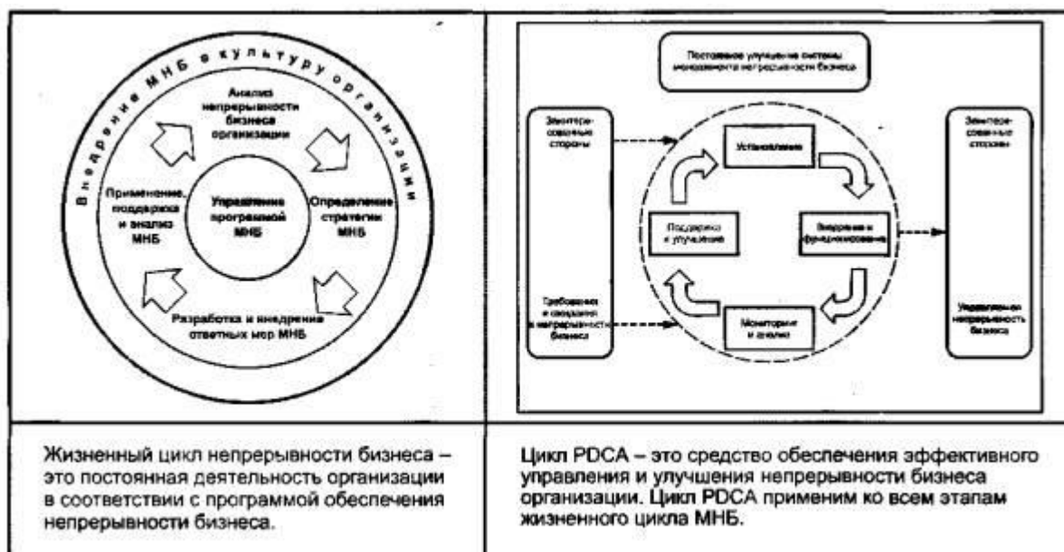
Рисунок 2 - Элементы жизненного цикла менеджмента непрерывности бизнеса

В качестве синонимов термина «менеджмент непрерывности бизнеса» часто используют термины «управление непрерывностью бизнеса», «управление непрерывностью деятельности», «управление бесперебойностью работы». Выбор термина зависит от потребностей организации и требований ее причастных сторон.