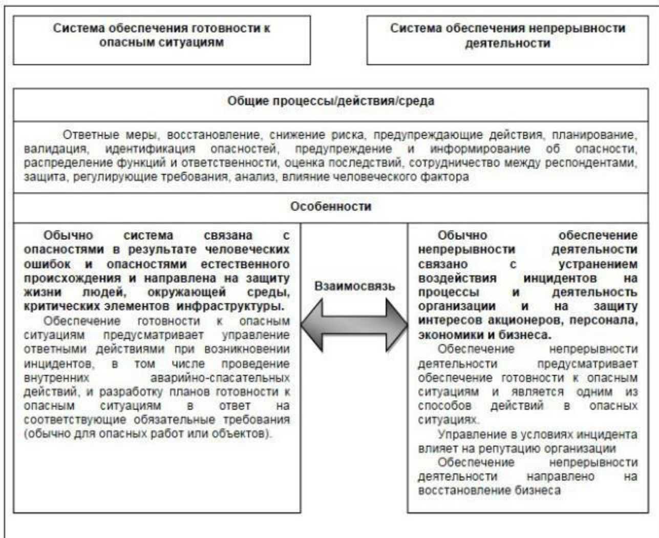
Рисунок 2 - Взаимосвязь элементов системы обеспечения готовности к опасным ситуациям и инцидентам и обеспечения непрерывности деятельности

Общие элементы менеджмента программы обеспечения готовности к опасным ситуациям и инцидентам и непрерывности деятельности должна включать: