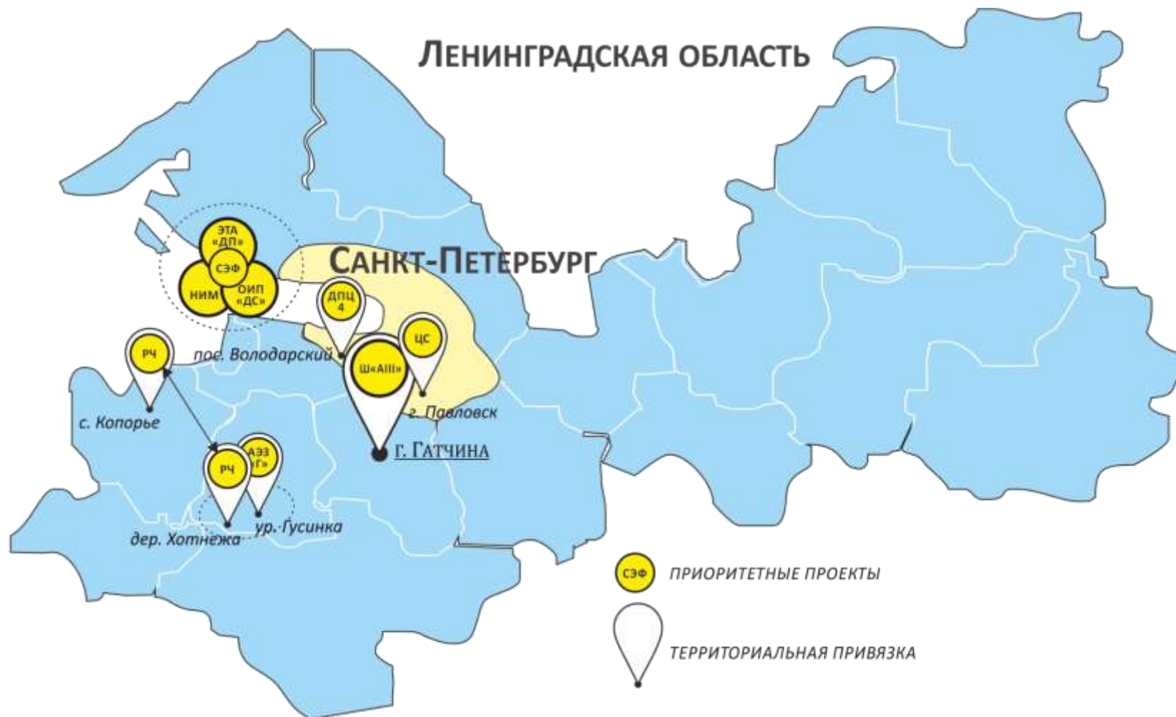
Рис. 1. Приоритетные проекты

Ниже приводится перечень приоритетных инвестиционных проектов развития социальной среды и реального сектора экономики Ленинградской области, предлагаемых для рассмотрения и возможного участия в осуществлении потенциальными инвесторами (рис. 1.)