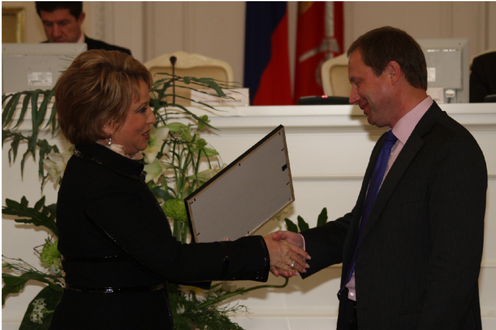
ЗАО "СК "Капитал-полис"