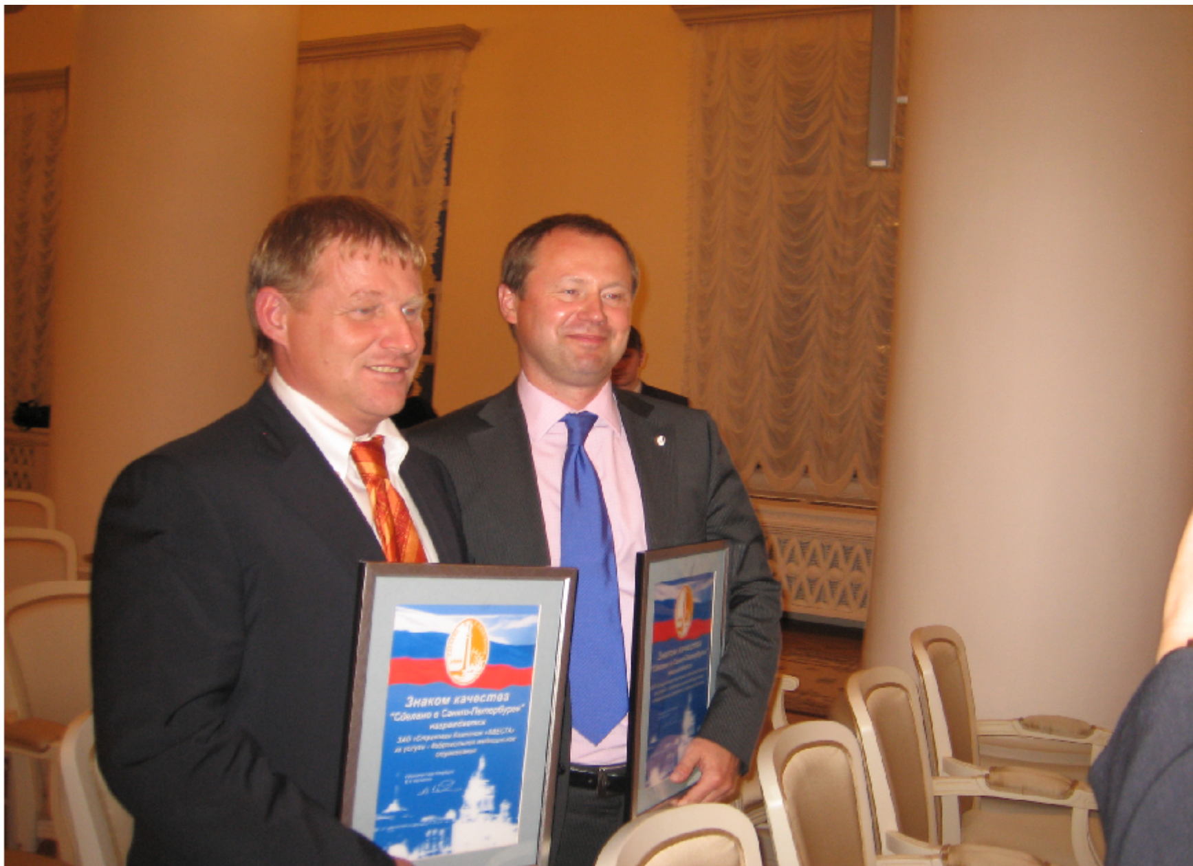
ЗАО "СК "Капитал-полис"