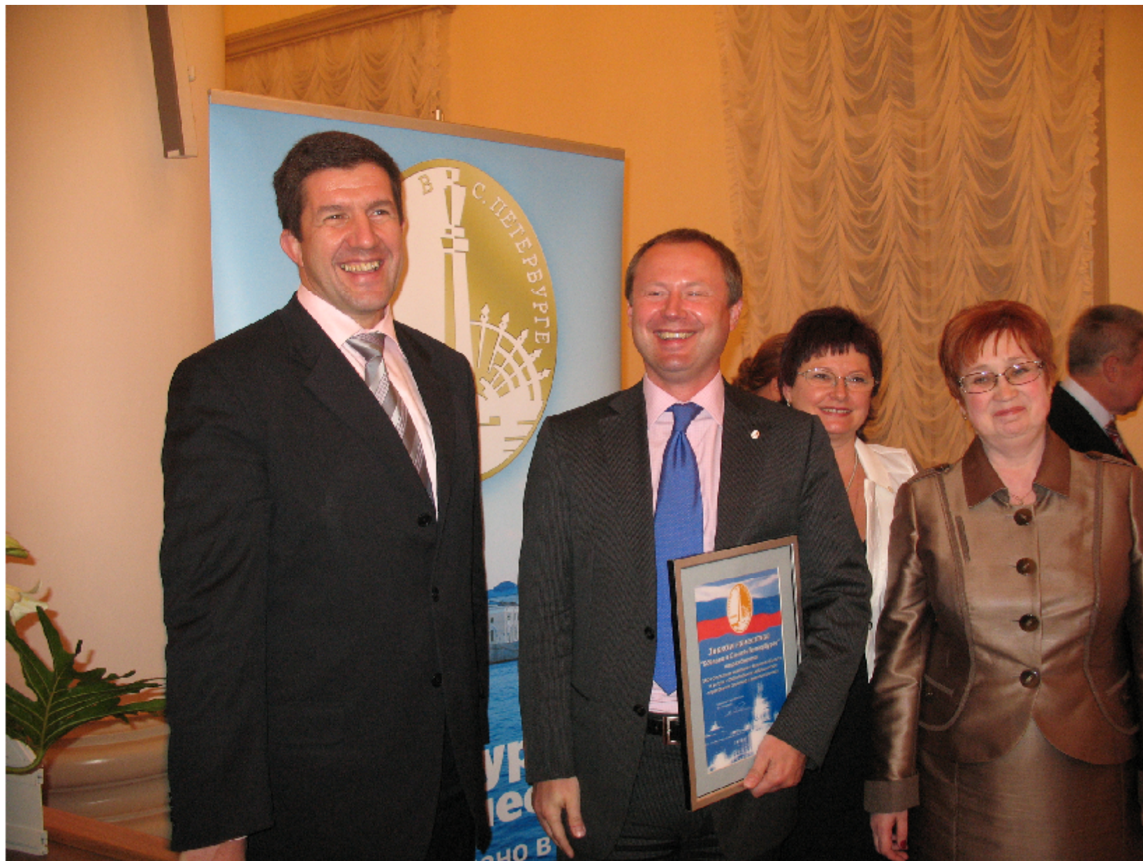
ЗАО "СК "Капитал-полис"