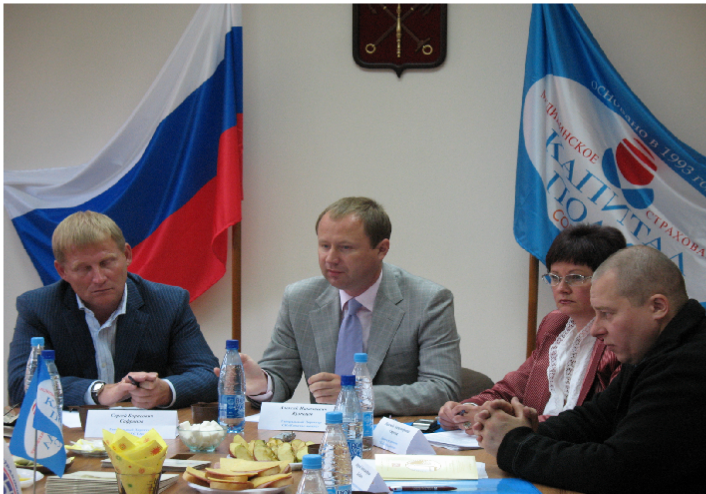
ЗАО "СК "Капитал-полис"

Союзом Страховщиков Санкт-Петербурга и Северо-Запада был проведен брифинг, посвященный Конкурсу страховых компаний Санкт-Петербурга.