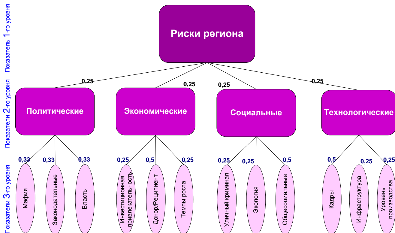
Рис. 2. Система показателей для оценки региональных рисков

Базовая система показателей для оценки регионов приведена на рис. 2.